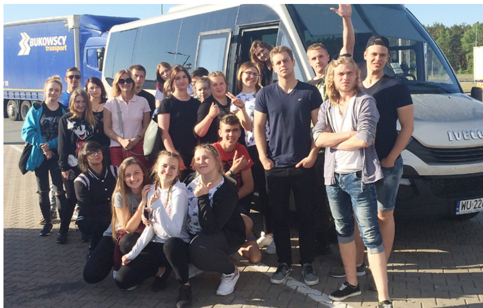
W podróży komfortowym autobusem