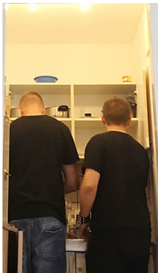
Stażyści w kuchni podczas przygotowania kolacji

Uczniowie technikum zobaczyli wiele. Niektórzy może już nigdy nie pojedą do Lipska, a inni, zuroczeni miastem, może wybiorą się tam jeszcze wiele razy.