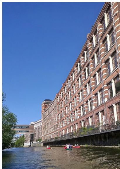
Praktykanci płynący kanałami Białej Elstery

Młodzież z Warszawy prawie codziennie wyruszała z Augustusplatz, aby poznać historię i architekturę najciekawszych miejsc miasta. Centralną część placu zajmowała fontanna (miejsce zbiórek), a wokół niej wznosiły się gmachy Uniwersytetu, Opery i nowoczesnej Sali Koncerowej. Nad wszystkim górował gmach MDR-Kubus służący próbom i nagraniom MDR Radio Choir i MDR Symphony Orchestra. Stamtąd roztaczał się wspaniały widok na miasto.