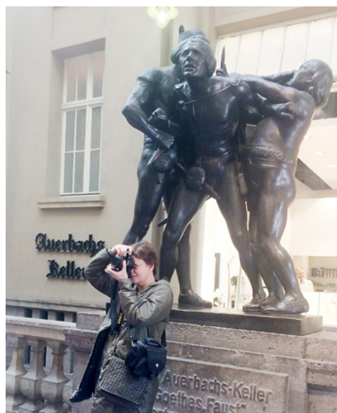
Przed Piwnicą u Auerbacha

Idąc w kierunku starego placu targowego, można było odwiedzić Dwór Drezdeński z pasażem handlowym i Piwnicę Auerbacha upamiętnioną w Fauście J.W.Goethego, i oferującą tradycyjną kuchnię niemiecką.