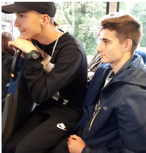
W podróży punktualnym lipskim tramwajem