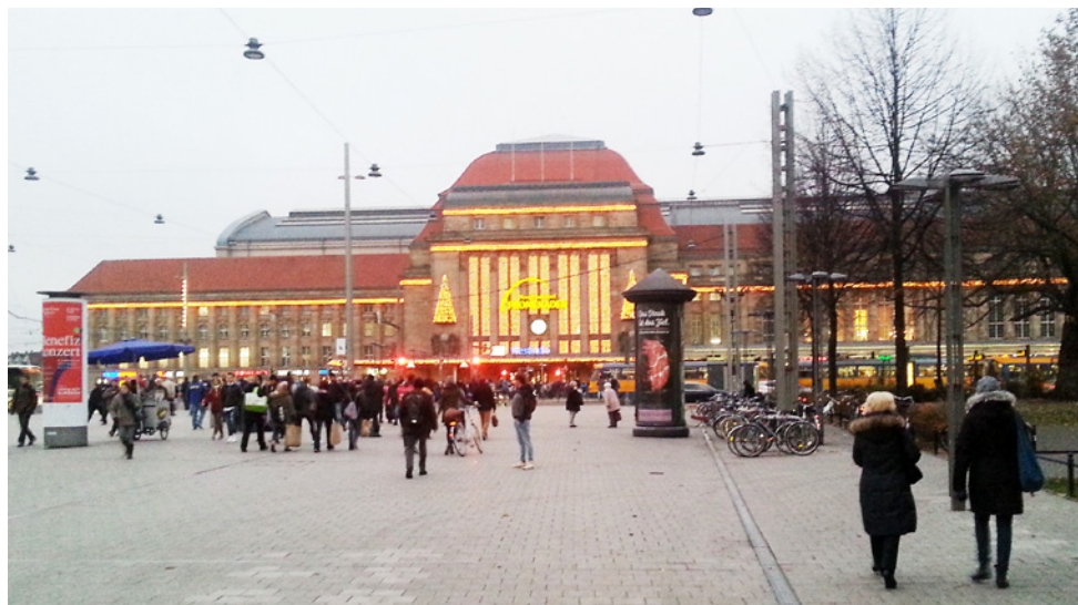
Przed lipskim dworcem kolejowym

8 miesięcy przed rozpoczęciem stażu 1 grupy uczniów odbyła się wizyta przygotowawcza, w której udział wzięły dyrektor CKZiU1, koordynator projektu i jedna z opiekunek stażystów w Lipsku.