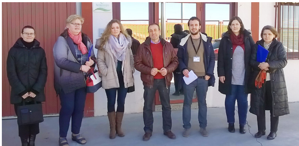
Przed siedzibą firmy nauczycielki i założyciele Gamo Energias

Staże JS w Salamance zostały przygotowane z instytucją pośredniczącą TELLUS Ltd. Wszystkie kontakty i komunikacja odbywały się online. W listopadzie i grudniu 2016 Tellus Ltd. poprosił o przygotowanie dodatkowych dokumentów, tj. Europass CV, PPI (Participant Programme Information). Na podstawie analizy tych dokumentów przygotował szkolenia dostosowane do doświadczenia i potrzeb uczestników.